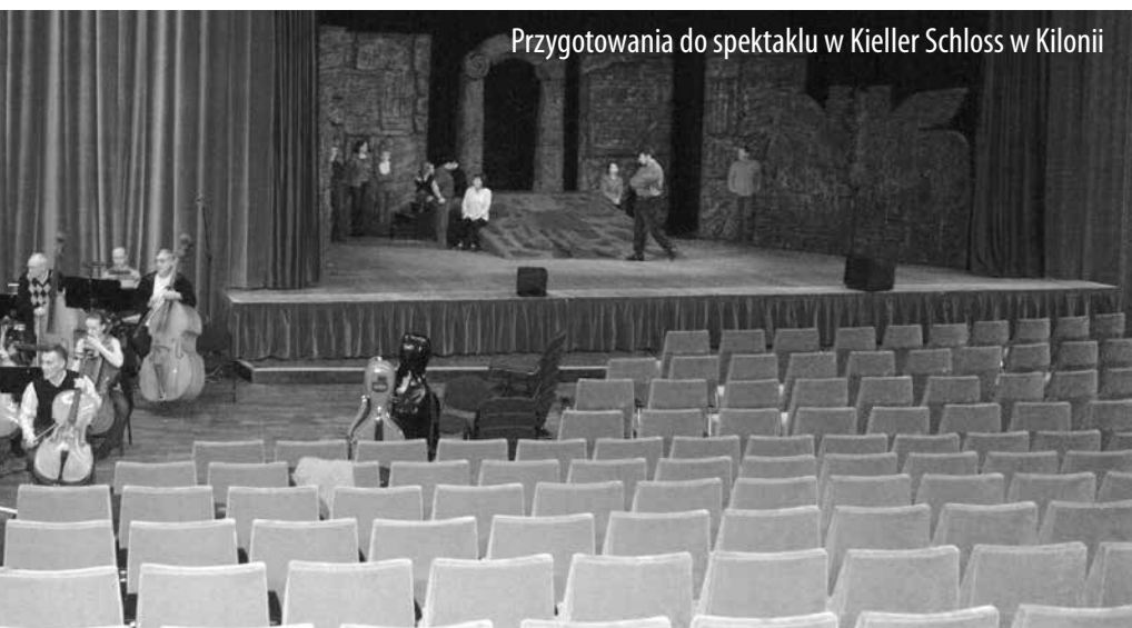
Przygotowania do spektaklu w Kieller Schloss w Kilonii