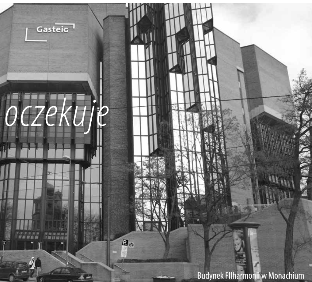
Budynek Filharmonii w Monachium