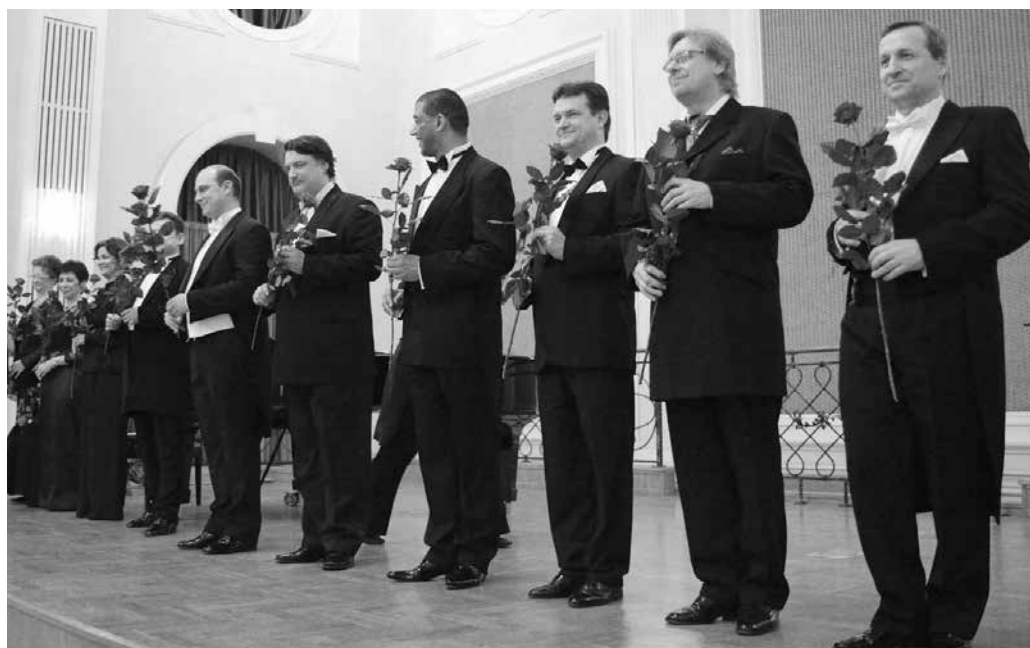
fot. Tomasz Zakrzewski