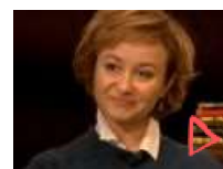
Koło pióra, 14.03.2019